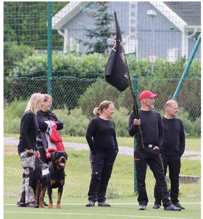
Kellokisa joukkueet avajaisissa Sauvossa.