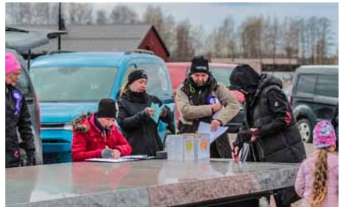
Match Show Haminassa. Osallistujina 66 koiraa.