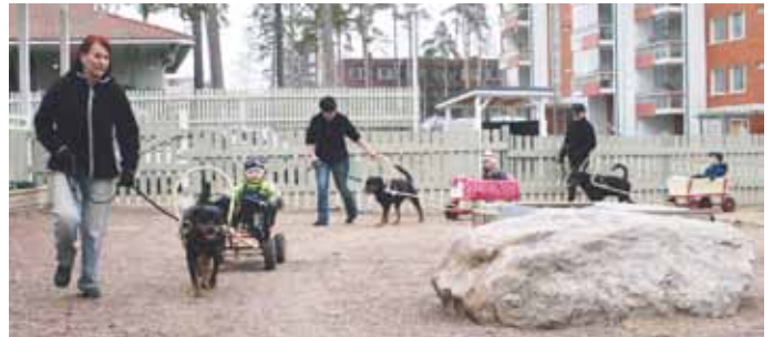
Päiväkoti Suckelassa lapsivetoa.