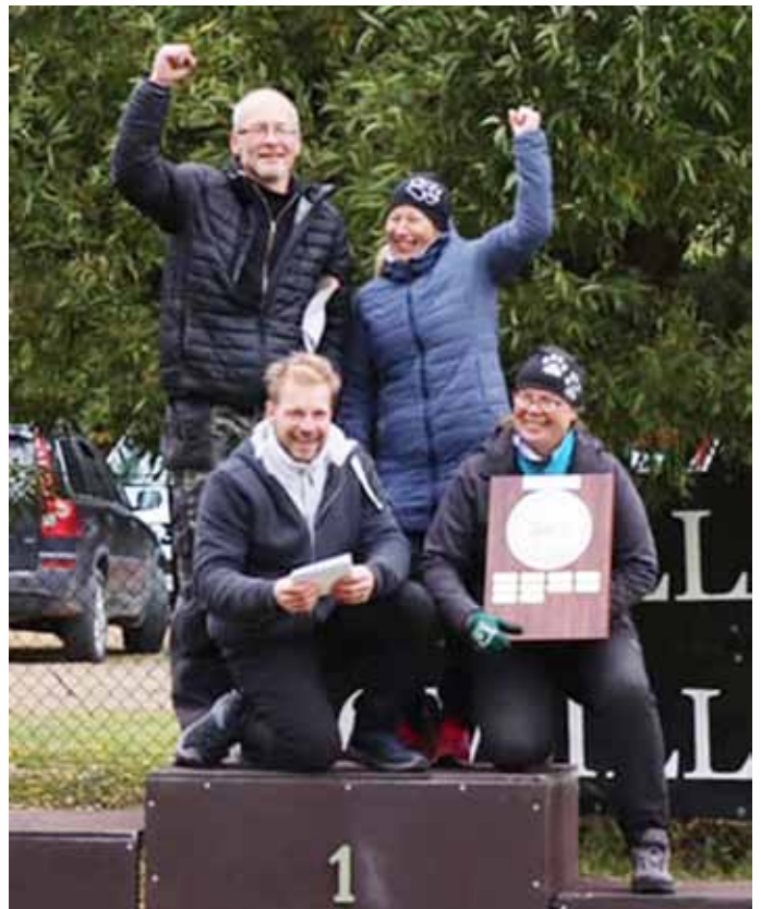
Kymenlaakso on voitti Tsempparikellon.