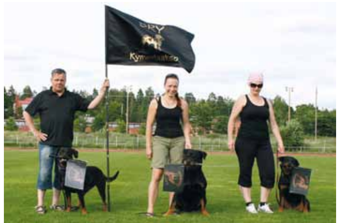
Kellokisajoukkue vuonna 2013.