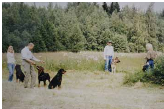
Kesäleirillä Rotikossa vuonna 1987.