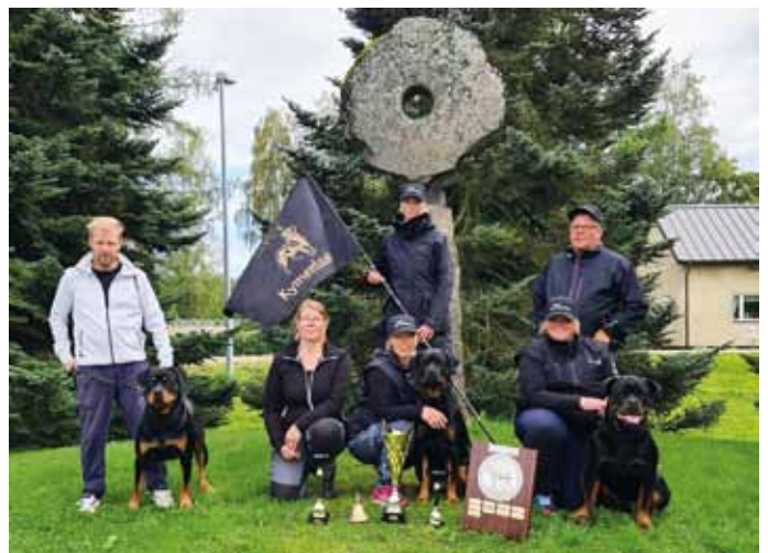
Alaosaston 1. ja 2. joukkue Päijät-Hämeen järjestämässä Kello- ja mestaruuskisoissa Kärkölässä.