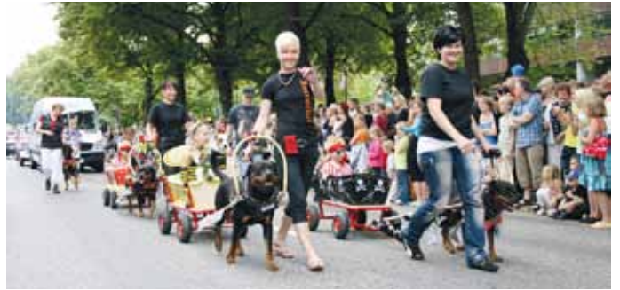
Kotkan meripäivät ja avajaisparaati vuonna 2012.