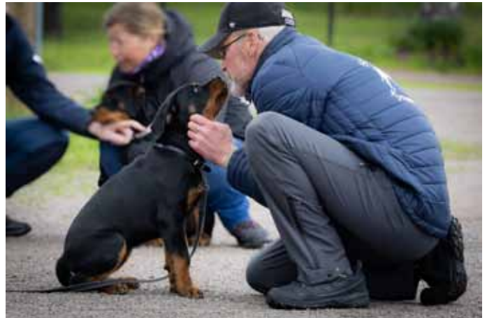
Tullaan tutuiksi tapahtuma Kotkassa 25.5.2025.

18.10.2025 Leikityspäivä Kotkassa, osallistujia 12 koirakkoa.