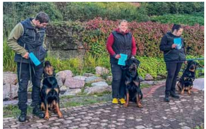
BH-kokeen hyväksytysti suorittaneet Kotkassa.