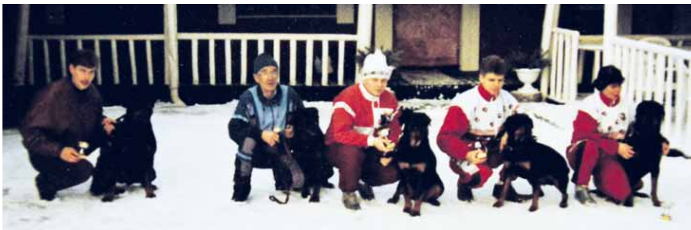
SRY:n vetomestaruuskisojen palkitut vuonna 1995 Palvaanjärvellä.