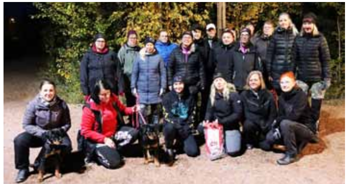
Tottiskauden päättäjaiset vietettiin mukavassa porukassa.