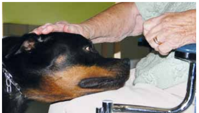
Palvelutalo Vetreassa rapsuteltavana.