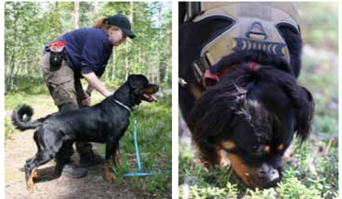
Esineruutu ja jälki metsäpäivä Haminassa 9.8.2025.