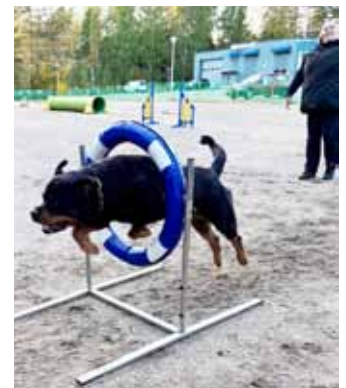
Kauden päättäjäiset Kotkassa ja Lappeenrannassa.