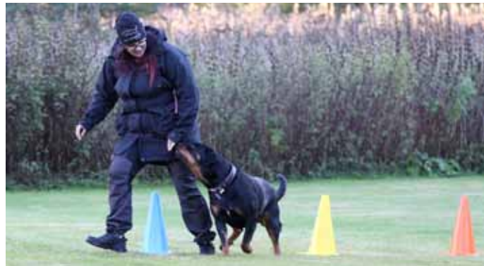
Tottiskoulutukset aloitettiin ja lopettiin leikkimielisellä koirien ja ohjaajien tempuradalla.

6.10.2022 starttasivat alaosaston omatoimi tottistreenit Koirakkona Oy:n hallissa Haminassa. Treenit ovat torstaisin klo 17-21.