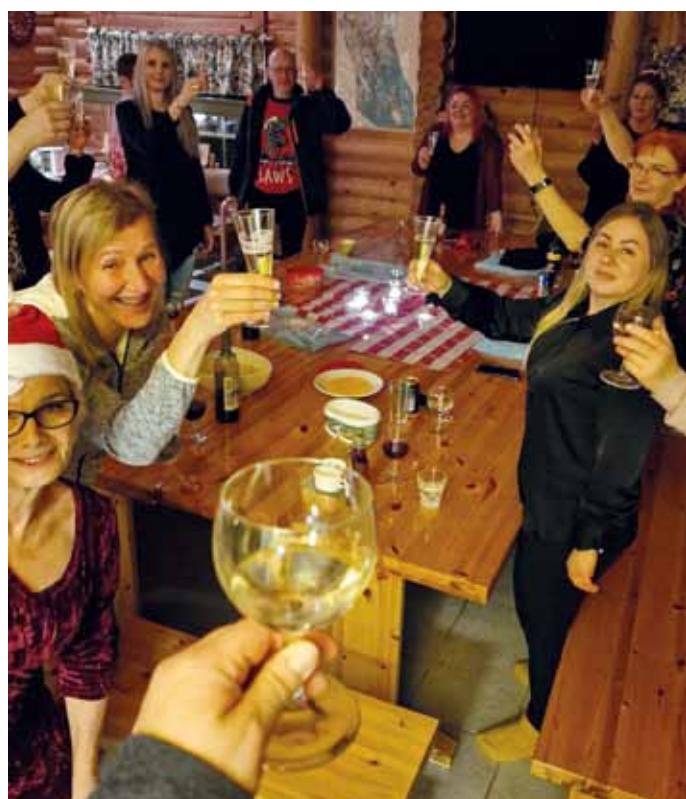
Pikkujoulu Laajakosken kylätuvalla.