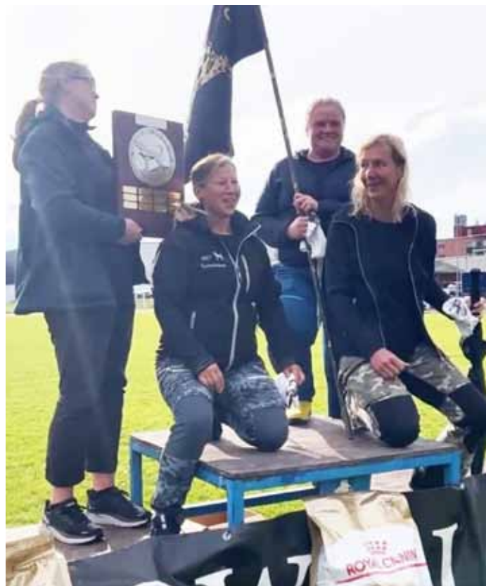
Alaosaston joukkue vastaanotti tsempparikellon Leppävirralla.