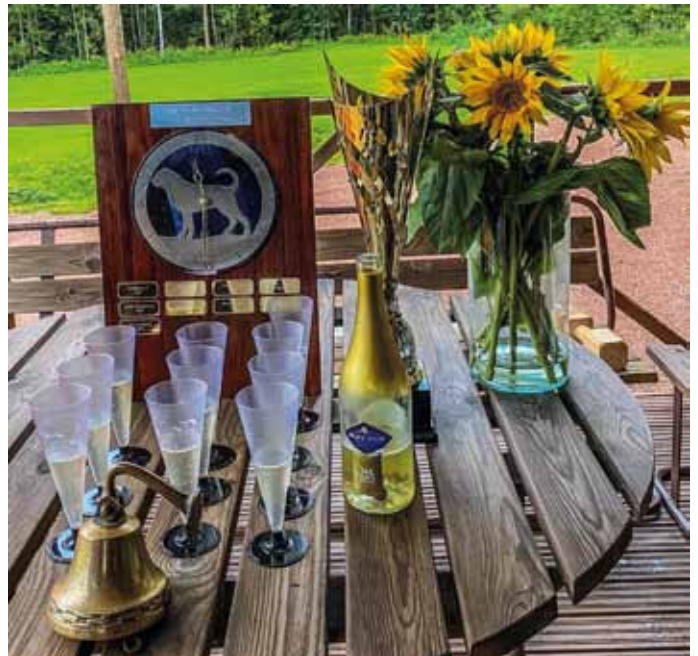
Kellot tulivat Kymenlaaksoon! Laivakelloa ja tsempparikelloa juhlittiin Kotkassa alaosastolaisten kanssa tottiskentällä.