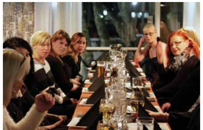
30-vuotis syntymäpäivä juhlat Cafe Laituri, Kotka.