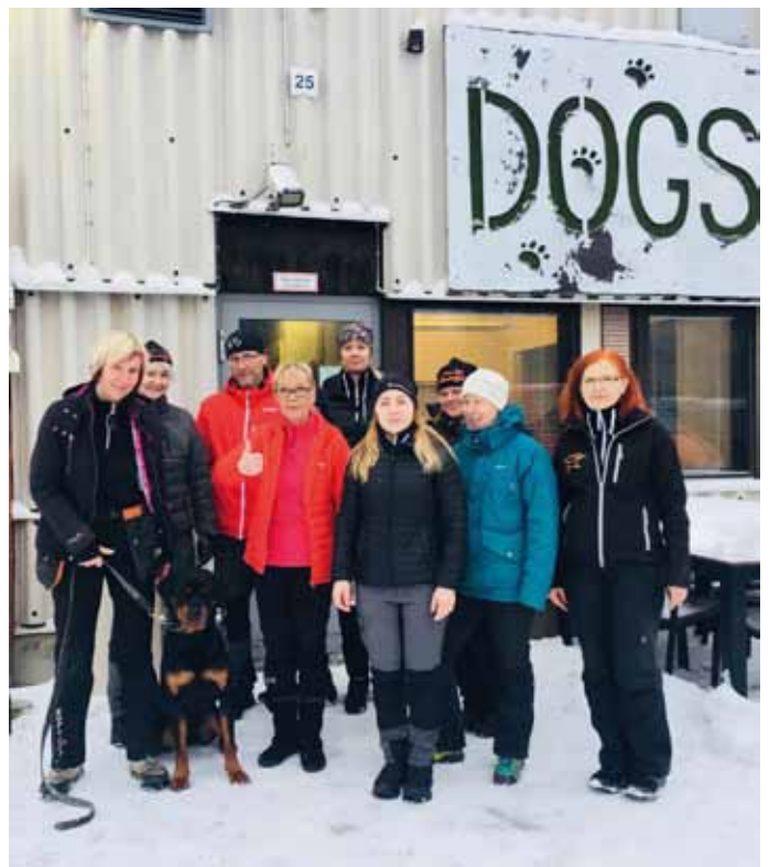
Talkooväen osallistujia Strömfors Dog Sports hallilla.