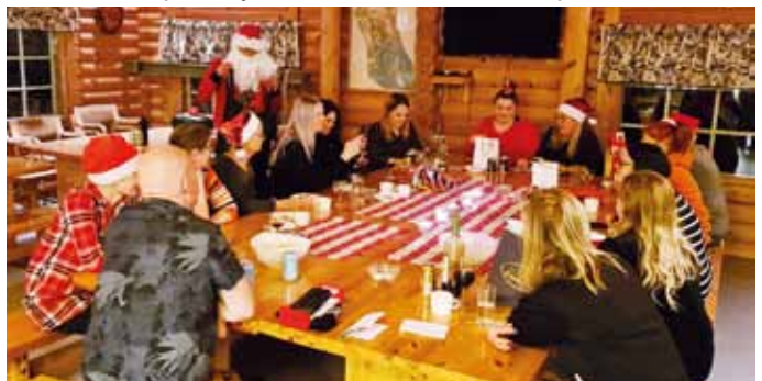
Pikkujouluihin osallistui 17 jäsentä Laajakosken Kylätuvalla.