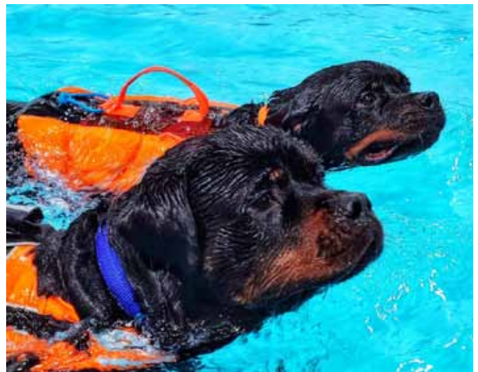
Uimarit Hyvänmielen koirakeskuksessa.