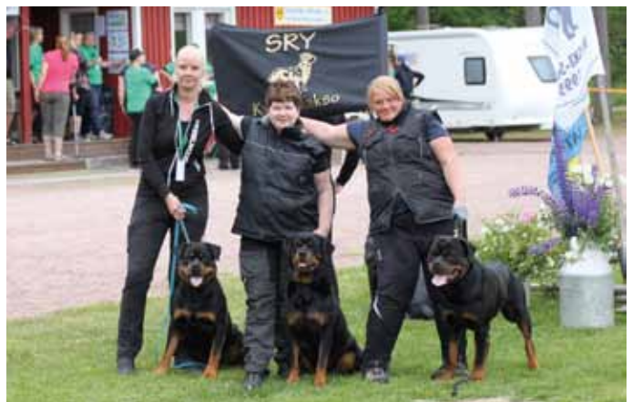
Alaosaston kellokisajoukkue 1 tytöt.