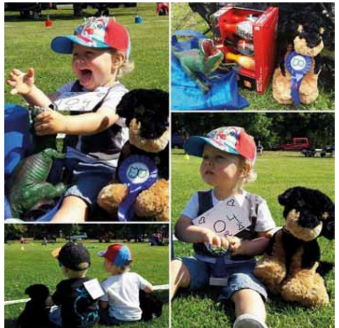
Heinäkuun Match Show nuorimmat "handlerit".