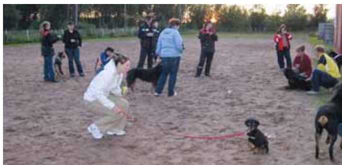
Tullaan tutuiksi ilta 2009.