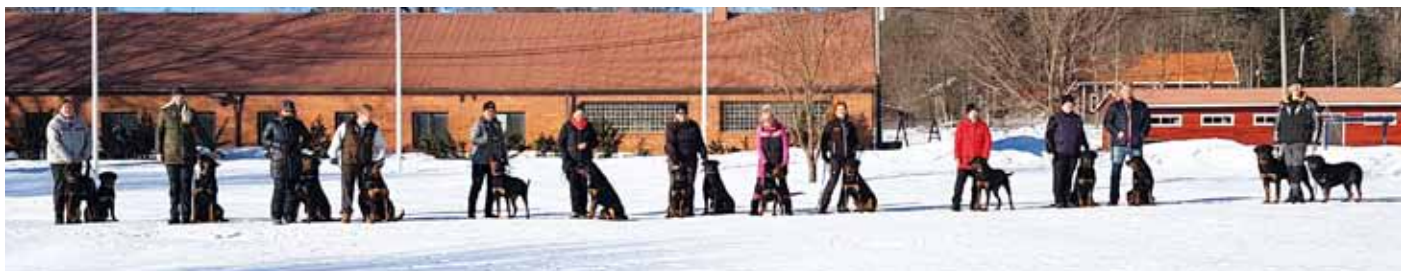
Kiitos ahkerille talkoilijoille 3.3.2019 Strömfors Dogsports, Ruotsinpyhtää. Kiitos avustasi päivään osallistui 16 koirakkoa.