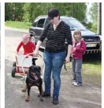
Toukotohinat Saksalan kentällä vuonna 2011.