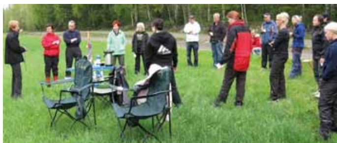
Jälkipäivä Askolassa 2009.