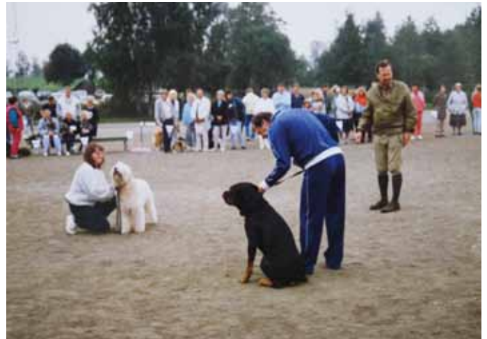
Match Show Karhulan keskus kentällä 1988. Osallistujia oli kahdeksankymmentä. Tuomarina toimi J.A.U. Yrjölä.