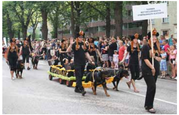
Kotkan meripäivät ja avajaisparaati vuonna 2013.