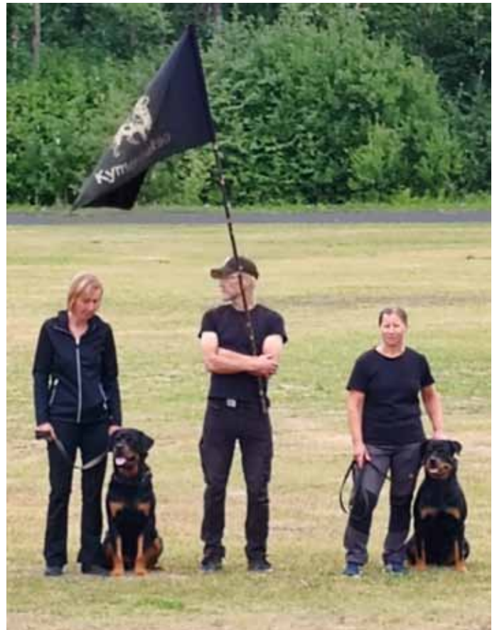
Alaosaston joukkue Kello- ja mestaruuskilpailussa.