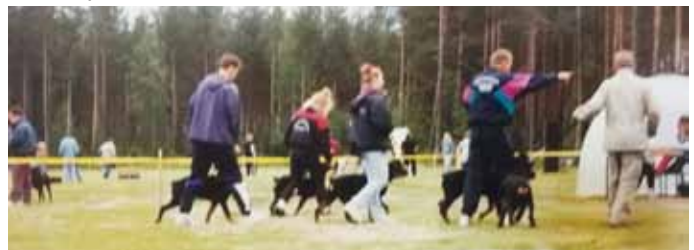
Erikoisnäyttely vuonna 1993.