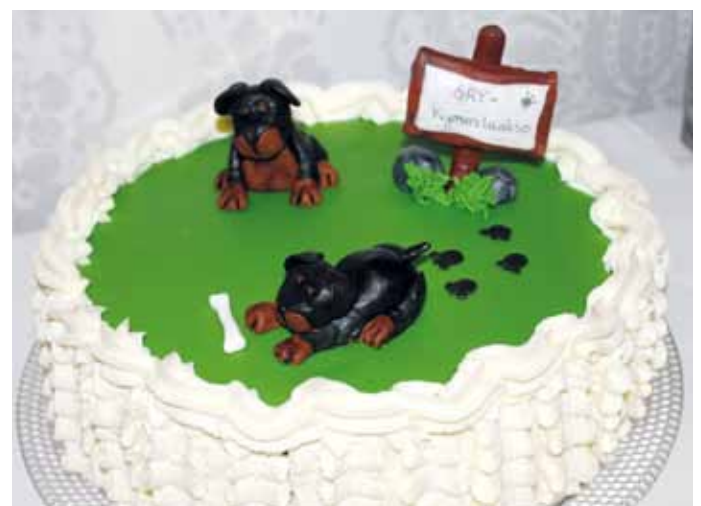
Rottweiler aiheinen synttärkakku.