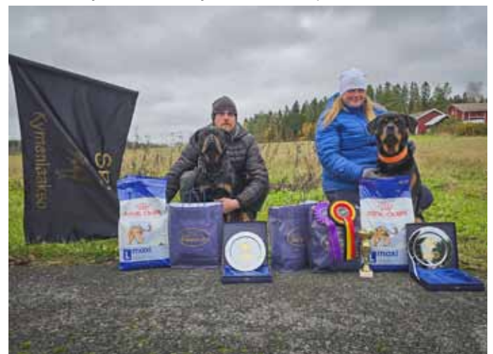
Alaosaston joukkue TOKOn rotumestaruuskilpailussa.