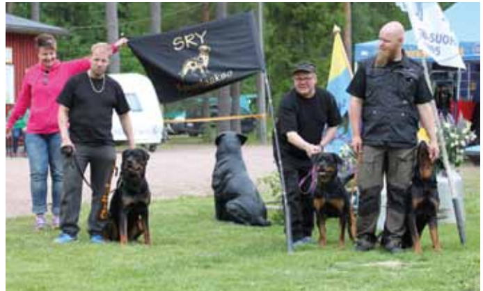
Alaosaston kellokisajoukkue 2 pojat.