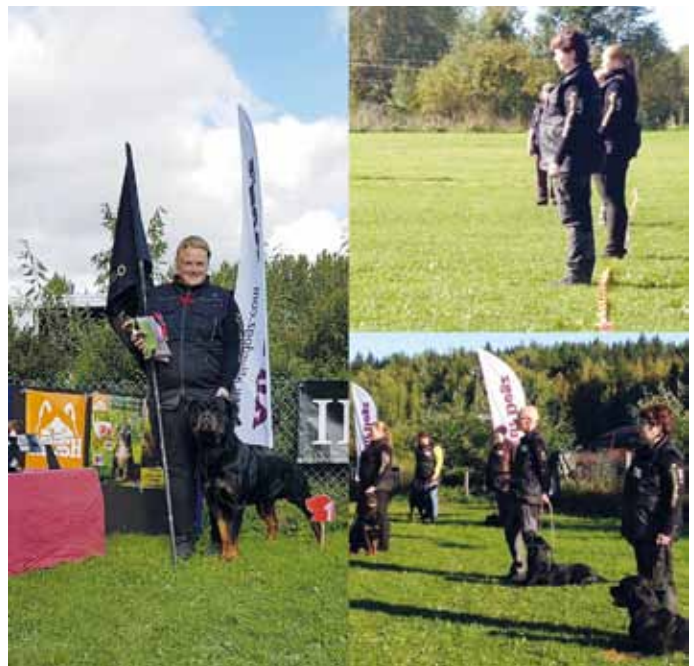
Alaosaston TOKO Rotumestaruuskisojen joukkue 2017.