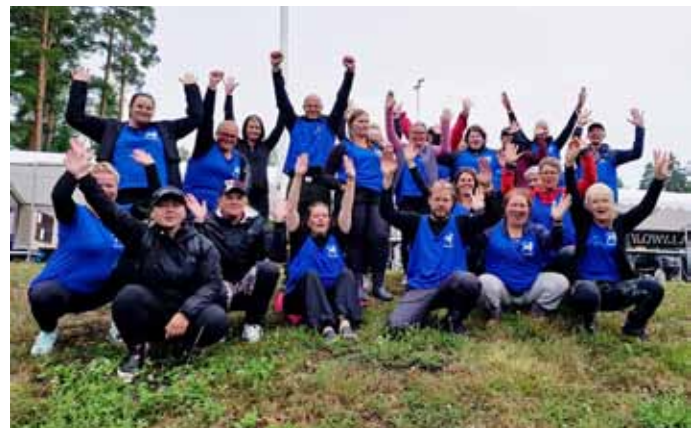
Kello- ja mestaruuskisojen talkoolaisia! Me teimme sen!