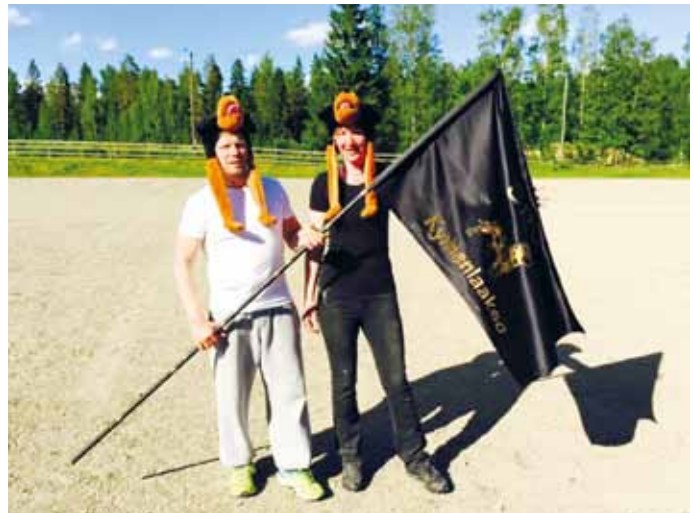
Kellokisarjoukkue vuonna 2015 Valkeakoskella.