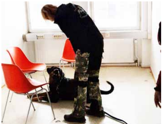
Mölli nosework-koe tukitapahtuma 14.9.2025 Kotkassa.