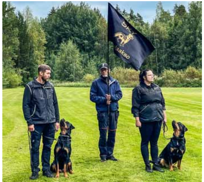
TOKO rotumestaruus kilpailussa joukkuepronssia.