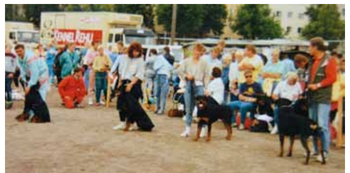
Kotkan näyttelytunnelmaa 1989.