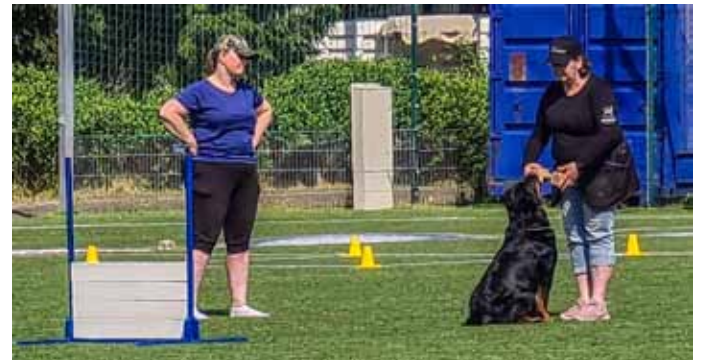
TOKO:n rotumestaruuskilpailu Sauvossa.