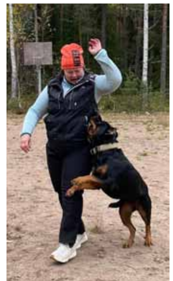
Syksyn tottelevaisuus / omatoimileiri 3.10.-5.10.2025.