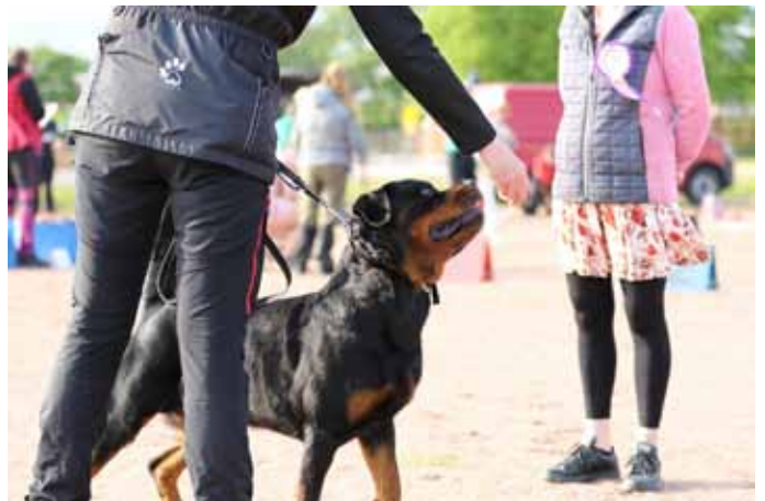
Match-show Haminassa 10.6.2025.