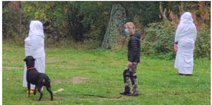
MH-kuvaus viikonloppu Rottishovissa, Tammelassa.