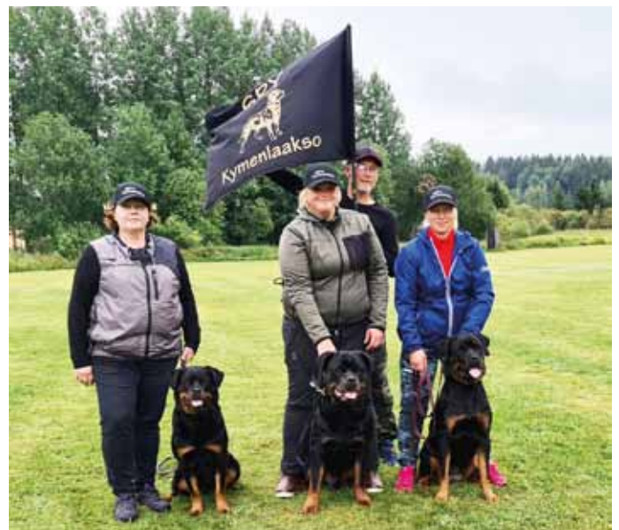
TOKO:n rotumestaruus kisoissa Kymenlaakson joukkue sijoittui joukkuekilpailussa viidenneksi.