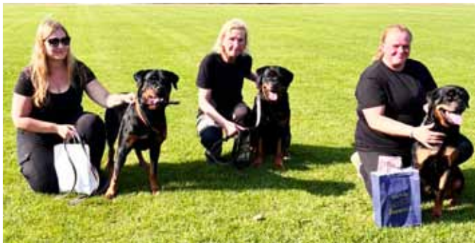
Alaosaston osallistui Kellokisoihin Kärkölään yhdellä joukkueella.