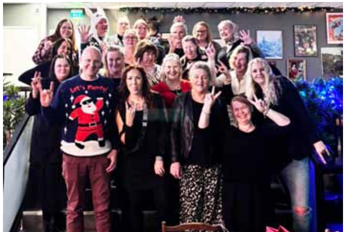
Pikkujouluet vietettiin 29.11.2025 Kotkassa Humppa karaokebaarissa 22 jäsenen voimin.