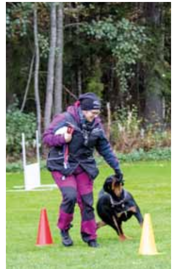
Kauden päättäjäiset Peippolan kentällä. Leikkimielisinä kilpailulajeina olivat mm. temppurata ja houkutusrata. Tarjolla oli jäsenistölle myös kahvia ja pullaa.