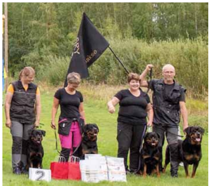
Alaostalon TOKO joukkue 2018 sijoittui toiseksi.