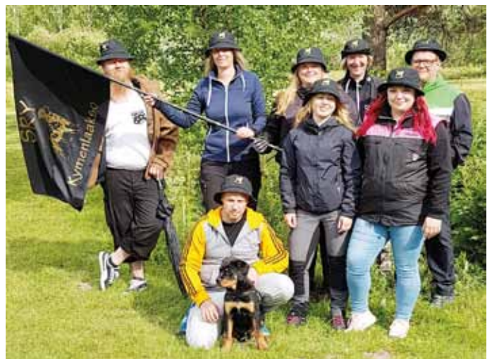
Alaostalon Kello- ja mestaruuskisan joukkueet.