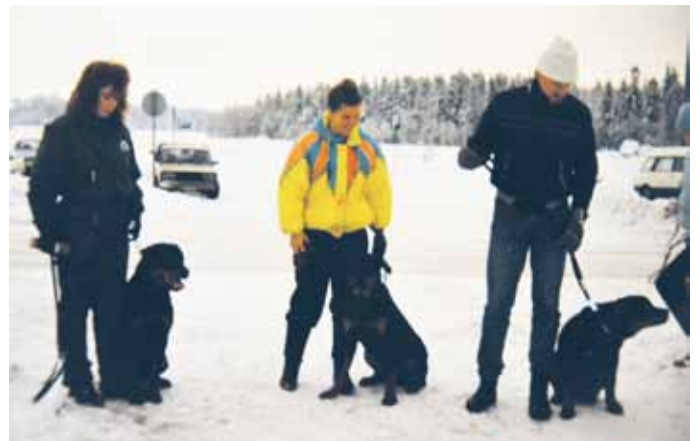
Tottisharjoituksissa City Marketin pihalla 1990.