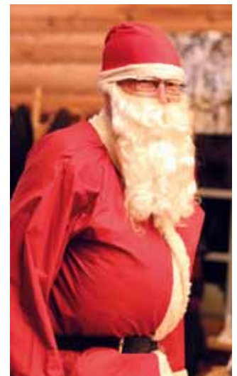
Pikkujoulujen bingo-emäntä ja joulupukki.