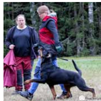
Syksyn tottelevaisuusleiri Lintukodossa.