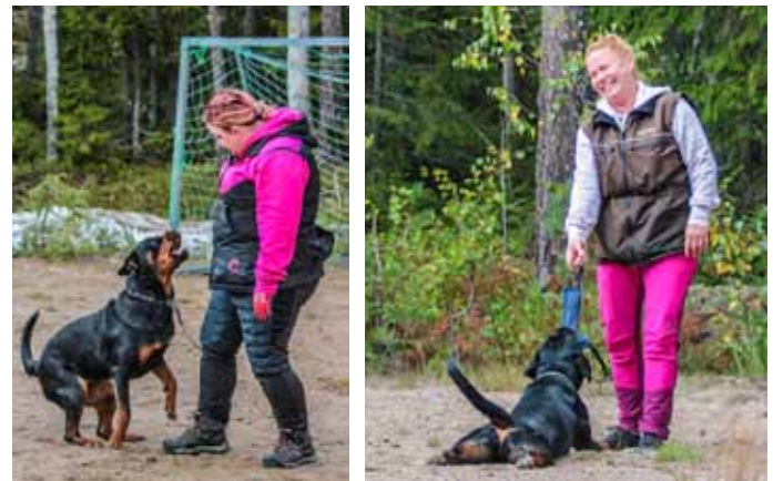
Syksyn tottelevaisuus/omatoimileiri Lintukodossa, Pyhällössä.