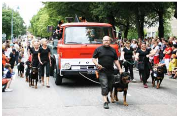
Kotkan meripäivät ja avajaisparaati vuonna 2016.